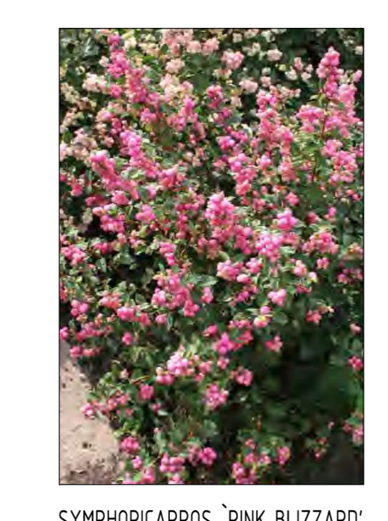
SYMPHORICARPUS 'PINK BLIZZARD'