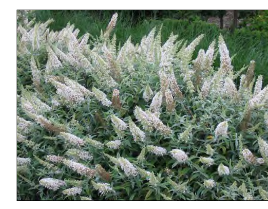
BUDDLEJA WHITE BALL