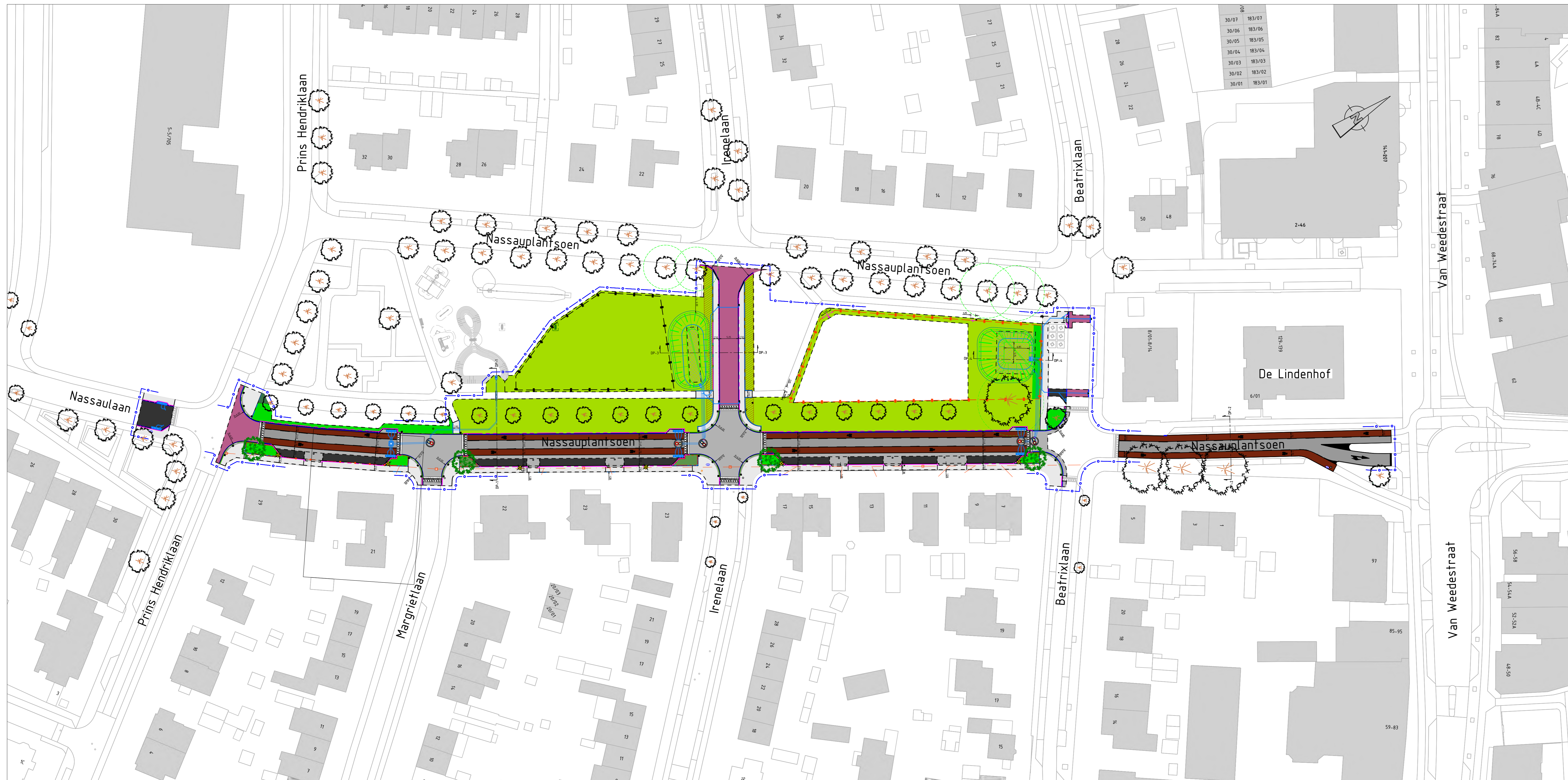
Situatie Schaal 1:500