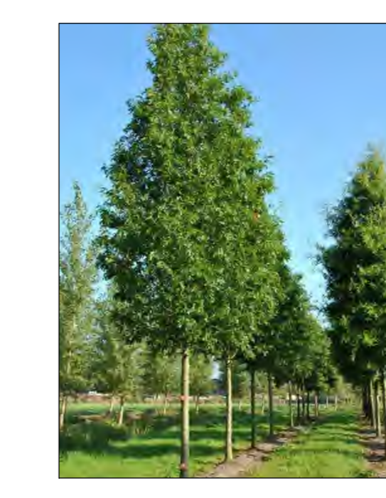
QUERCUS PALUSTRIS 'HELMOND'S RED GLOBE'