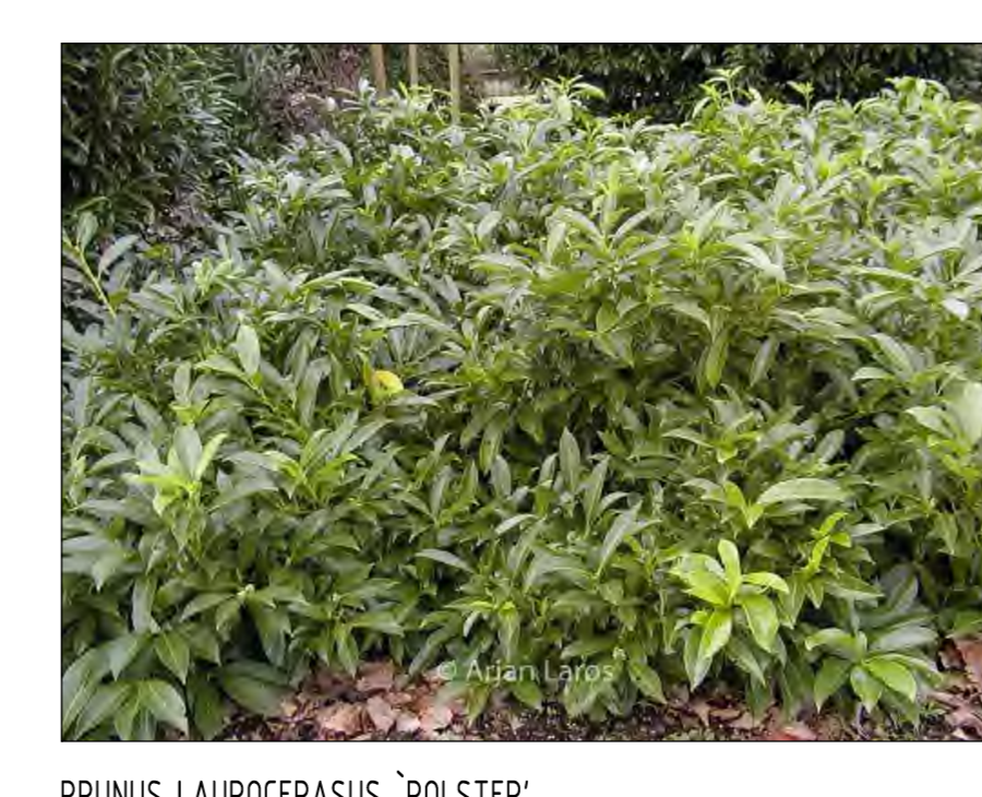
PRUNUS LAUROCERASUS 'POLSTER'